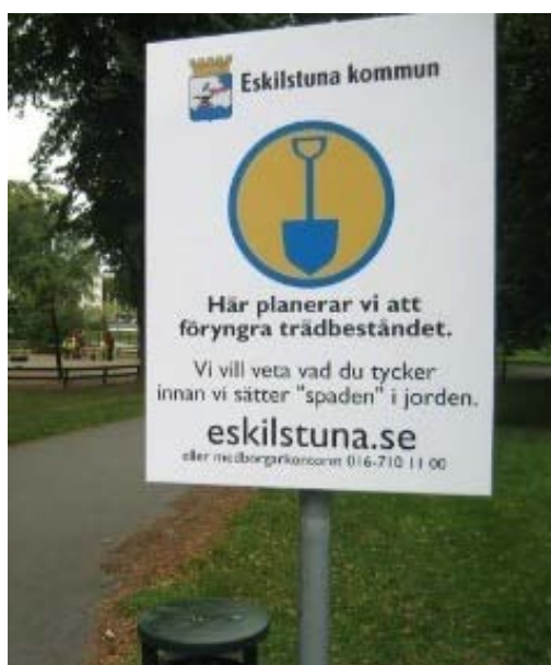
Figur 4. Exempel på ett spaden-projekt

Den mest tydliga och strukturerade metod vad gäller medborgarnas möjligheter att lämna synpunkter i ett tidigt skede, är det så kallade spadenprojektet, som Eskilstuna kommun själv kommit på. Denna metod går ut på att en skylt sätts upp i god tid innan spaden sätts i jorden dvs. i ett skede när det fortfarande finns stora möjligheter för medborgarna att påverka utformningen. På skylten står det en kort beskrivning av vad som planeras och att kommunen är intresserade av att ta emot medborgarnas synpunkter angående detta. Det står även vart medborgarna ska vända