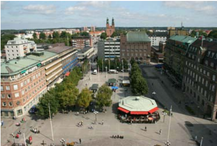
Figur 6. Fristadstorget

Intervjuundersökningen utgick då ifrån människors engagemang om torget skulle byggas om. Det var av största vikt att detta påtalades, så att människor inte skulle tro att en ombyggnation av torget verkligen var på gång.