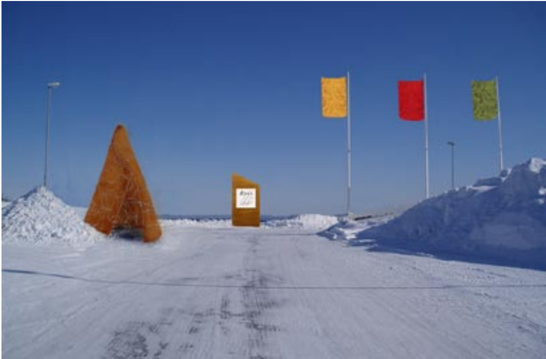
Första förslaget med en kåta som landmärke.