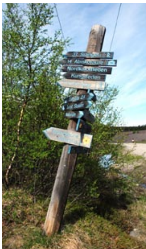
Traditionell vägvisare i fjällen.

Eftersom flertalet informanter 1 hade önskemål om att skyltarna skulle vara enkla och moderna använde jag mig av enkla, opretentiösa former. Det innebar att jag utgick från en rektangulär form som fick en spets upptill för att markera riktning, och svagt välvda ytor för att framhäva det tredimensionella i formen. Enklare och slätare former tenderar att se mer samtida ut än komplexa och brokiga, som ger ett mer traditionellt uttryck. (Calori 2007:158). Jag eftersträvade också att skapa ett samspel mellan den nya, moderna arkitekturen på området och stugorna från slutet av 1960-talet. Grundformen hämtades från en traditionell vägvisare i fjällen. Jag utgick från en pilform, men i en uppdaterad modell.