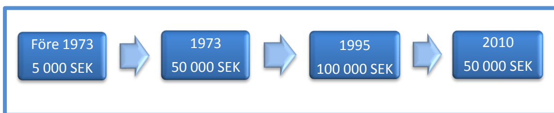
Figur 3 Förändring i kravet på aktiekapitalets storlek genom tiden (Källa: SOU 2009/10:61 s. 57-59 egen bearbetning)

Den 1 april 2010 ändrades kapitalkravet, vilket innebar att aktiekapitalet sänktes från 100 000 SEK till 50 000 SEK för privata aktiebolag. 69 Figur 3 nedan visar förändringen i kravet på aktiekapitalets storlek genom tiden.