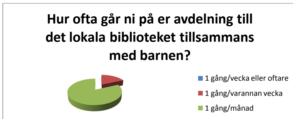
Figur 2. Hur ofta går ni på er avdelning till det lokala biblioteket tillsammans med barnen?

musikstunder är det som tas upp utöver att man besöker biblioteket för att låna böcker. De berättar även om hur förskolan har ett bokombud som ofta går på möten tillsammans med biblioteket och andra bokombud för att få tips om ny barnlitteratur. Majoriteten skriver att de nöjda med hur samarbetet ser ut idag, medans andra tycker att det skulle kunna utvecklas mer.