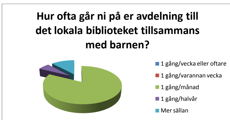
Figur 3. Hur ofta går ni på er avdelning till det lokala biblioteket tillsammans med barnen?

När jag sammanfattat enkäterna får jag fram att hälften av pedagogerna anser det vara viktigt att ha ett samarbete med biblioteket, medans andra hälften har fyllt i att det är mycket viktigt. De anledningar som oftast förekommer är att det är viktigt med läsning och böcker för språkutvecklingen, bokkunskapen och lärandet i stort. De flesta är överrens om att samarbetet är viktigt som en del i det pedagogiska arbetet och för att skapa nyfikenhet och lust till böcker. Det nämns också ett flertal gånger att bibliotekarierna besitter en kompetens som gynnar barnens språkutveckling. Dock finns det några enkätsvar där informanterna menar att de aldrig tänkt på biblioteket som en samarbetspartner och att detta skulle göra varken till eller från i deras arbete