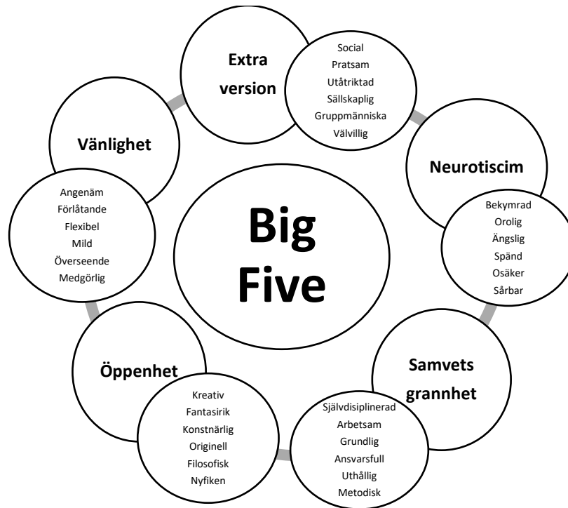
Figur 1. Big Five enligt Shafer's personality scale.

personlighetsegenskaper. Fler underkategorier kan relateras till modellens fem dimensioner öppenhet, samvetsgrannhet, extraversion, vänlighet och neurotiscim (Goldberg, 1990). Se Figur 1. Öppenhet inkluderar egenskaper såsom kreativitet och fantasi. Samvetsgrannhet innefattar ett målstyrt beteende som att organisera och prioritera. Extraversion är relaterat till positiva emotioner och självsäkerhet. Vänlighet innefattar egenskaper såsom ömhet och förtroende. Neuroticism är relaterat till negativa emotioner och egenskaper såsom oro, nervositet och spändhet (Ulu & Tezer, 2009).