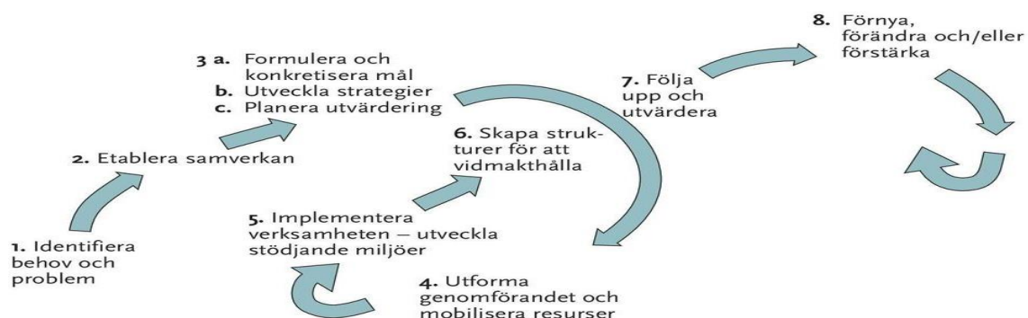
Figur 3. SESAME för stödjande miljöer för hälsa (Haglund, 1996).