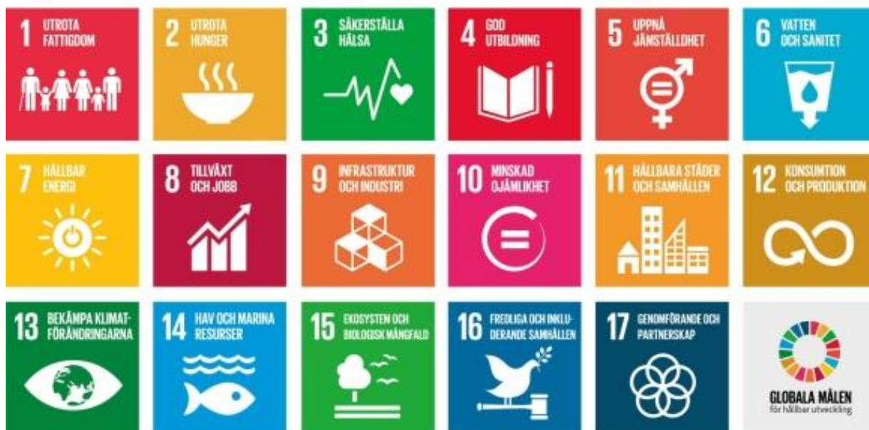
Figur 2. Sjutton globala mål för hållbar utveckling i Agenda 2030 (United Nation, 2019)